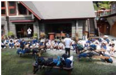
体験前のオリエンターリングに