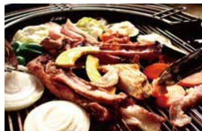
予算に応じて内容変更可