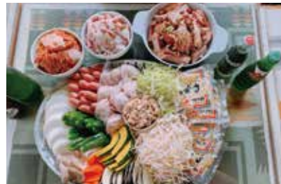
BBQセット (要予約・制限有)