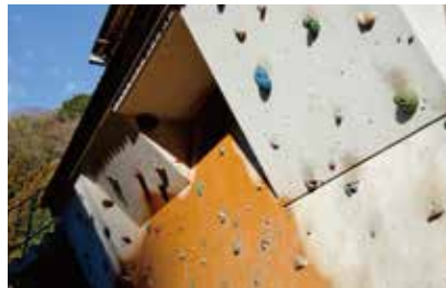
自由に遊べるボルダリングウォール